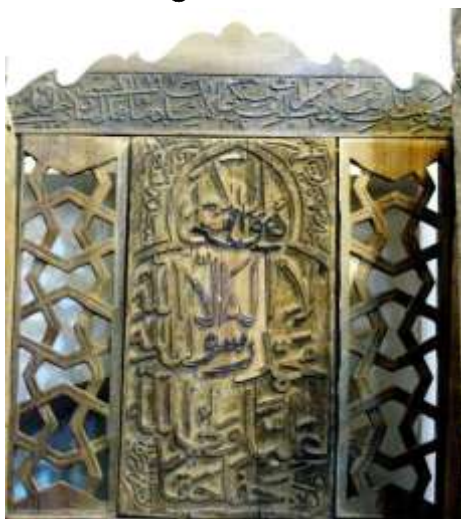
عکس ۲: کتیبه‌های تکیه‌گاه مسند حاوی شعار «لا اله الا الله محمد رسول الله عليا ولي الله حقا حقا» (قاسمی ۱۳۹۱)