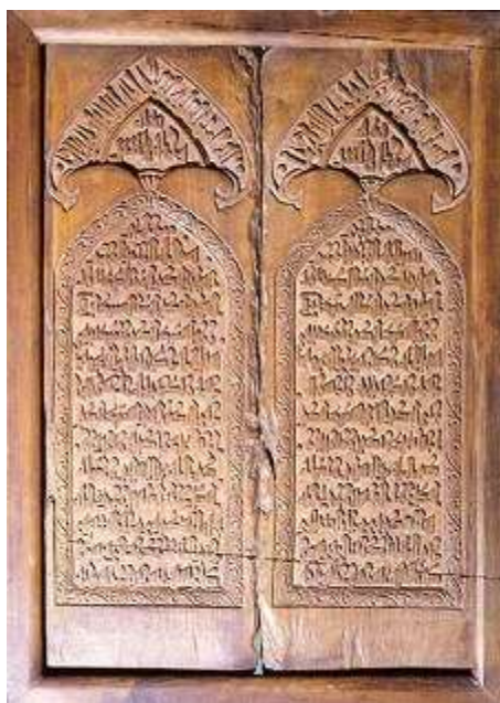
عکس ۴: پنجره چوبی موزه ملی ایران