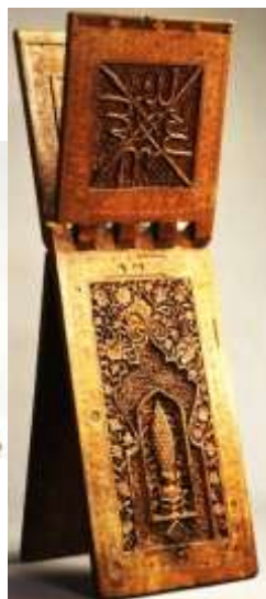
عکس ۶: نمای کلی رحل چوبی موزه متروپولیتن