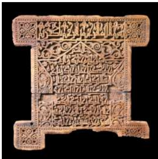
عکس ۳: لوح چوبی مجموعه دیوید