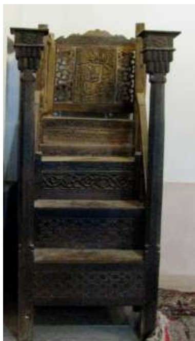
عکس ۱: نمای کلی منبر مسجد جامع ایبانه (قاسمی، ۱۳۹۱)