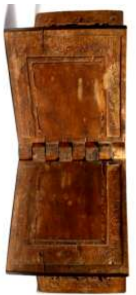
عکس ۷: کتیبه‌های داخل رحل موزه متروپولیتن (www.metmuseum.org)