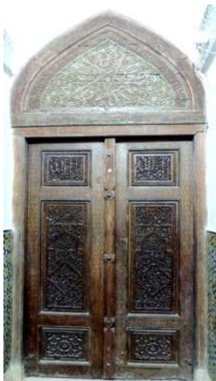
عکس ۵: میان در امامزاده اسماعیل علیه السلام